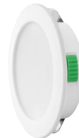
Botón para cambio de la temperatura de color.